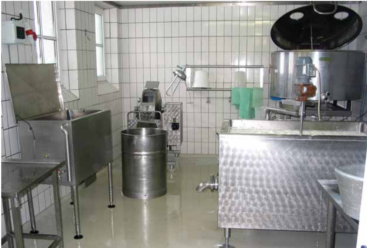
Bild 9: Stehen am Betrieb größere Investitionen an, kann die Option zur Regelbesteuerung durchaus sinnvoll sein.