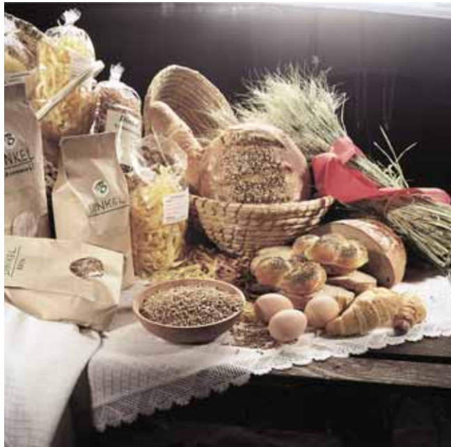
Bild 2: Zum Verarbeitungsnebgewerbe gehören alle Produkte die nicht in der Urprodukteverordnung aufgelistet sind und für die eine Form der Be- und Verarbeitung notwendig ist.