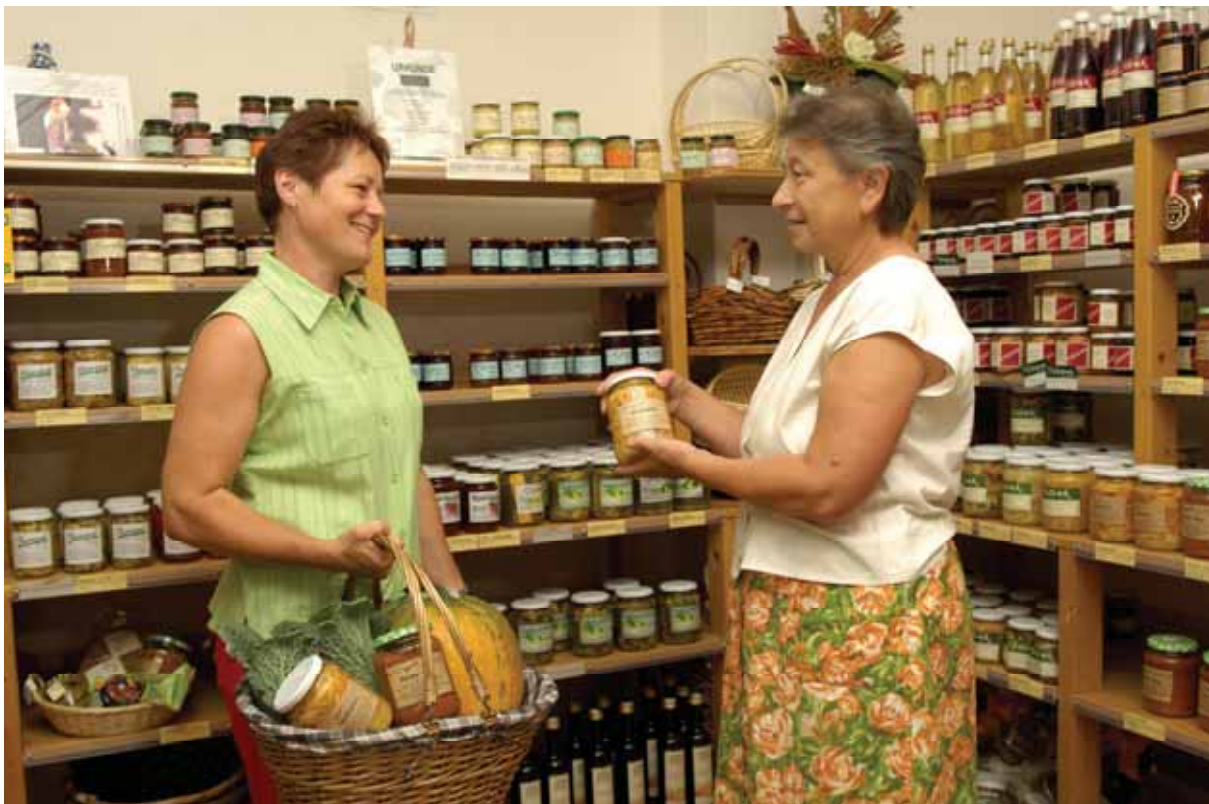
Bild 9: In einem Bauernladen müssen die Umsätze jedem Direktvermarkter einzeln zugerechnet werden.