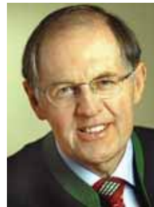
DI Niki Berlakovich Landwirtschaftsminister

Nach eigenen Angaben betreiben ein Drittel der österreichischen Landwirte Direktvermarktung. Knapp 20.000 Betriebe erwirtschaften damit über ein Fünftel ihres Einkommens. Die Direktvermarktung wird somit auch zukünftig bedeutend bleiben.