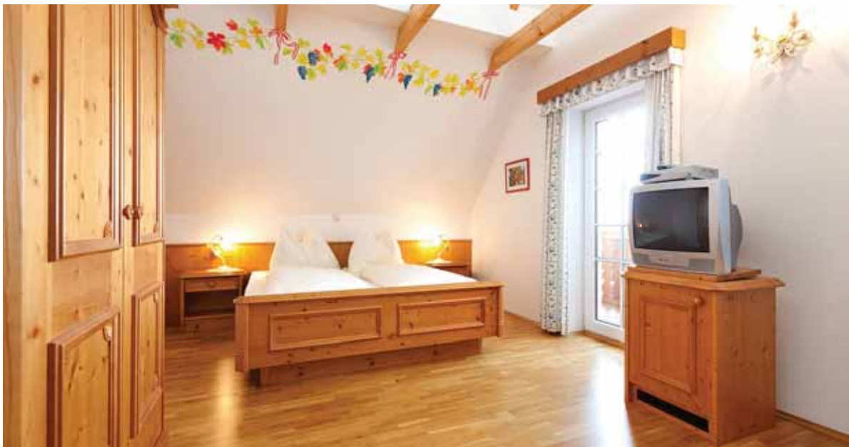
Bild 6: Für Einnahmen aus Privatzimmervermietung in Form von „Urlaub am Bauernhof“ steht ein eigener Freibetrag von € 3.700 zu.

Auch die Einnahmen aus solchen Tätigkeiten sind aufzuzeichnen und bis spätestens 30. April des dem Beitragsjahr folgenden Kalenderjahres der SVB bekanntzugeben. 30 % der Einnahmen bilden die Beitragsgrundlage, von der die Pensions-, Kranken- und Unfallversicherungsbeiträge nach den allgemeinen Beitragssätzen zu entrichten sind. Bei der sonstigen häuslichen Nebenbeschäftigung steht der Freibetrag von € 3.700,- nicht zu . Allerdings kann auch hier alternativ zur pauschalen Bemessung die Berechnung nach dem Steuerbescheid (siehe 2.3.2.) verlangt werden.