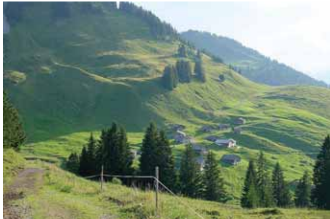
Bild 3: Die Bewirtschaftung der Alm ist Bedingung für den Almausschank.

Als land- und forstwirtschaftliches Nebengewerbe gelten auch die Verabreichung und das Ausschanken selbsterzeugter Produkte sowie von ortsüblichen, in Flaschen abgefüllten Getränken im Rahmen der Almbewirtschaftung (siehe auch 1.5.). Die Alm, auf der die Verabreichung erfolgen soll, muss gerade „bewirtschaftet“ sein; es müssen also Tiere aufgetrieben sein. Die eigene Erzeugung der Produkte muss allerdings nicht auf der Alm erfolgen.