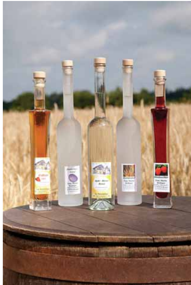
Bild 11: Zur Herstellung von Alkohol unter Abfindung werden selbstgewonnene alkoholbildende Stoffe auf einem zugelassenen einfachen Brenngerät verarbeitet.

Wird eine zur Herstellung von Alkohol verwendete Vorrichtung erworben oder veräußert (z.B. Übergabe/Übernahme bzw. Verkauf/Kauf eines land- und forstwirtschaftlichen Betriebes), muss dies dem zuständigen Zollamt innerhalb einer Woche (gerechnet vom Eintritt des anzuzeigenden Ereignisses) schriftlich angezeigt werden. Die Anzeige kann formlos oder unter Verwendung eines Formblattes (siehe Änderungsanzeige im Anhang) erfolgen. Von der Meldepflicht ausgenommen sind Brenngeräte bis 2 Liter, die nicht zur Alkoholherstellung verwendet werden (z.B. zu Ausstellungszwecken).