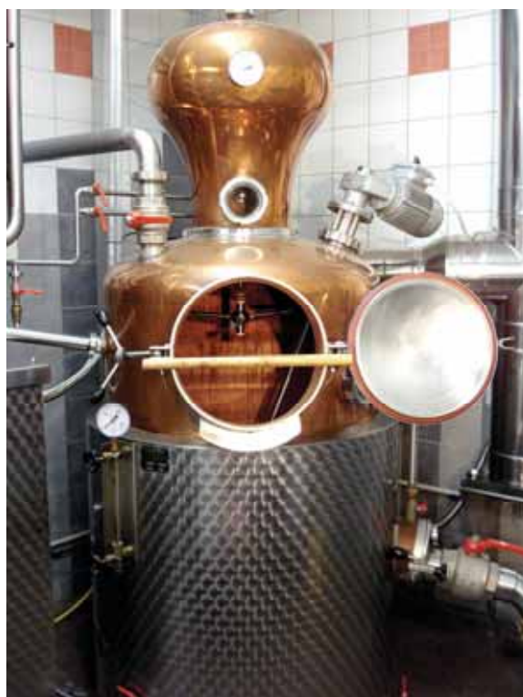
Bild 12: Zur Herstellung von Alkohol unter Abfindung sind nur einfache Brenngeräte erlaubt.

Eine Bewilligung gilt als erteilt, wenn das Zollamt nicht innerhalb von 3 Tagen nach Anmeldung einen abweisenden oder berichtigenden Bescheid erlässt.