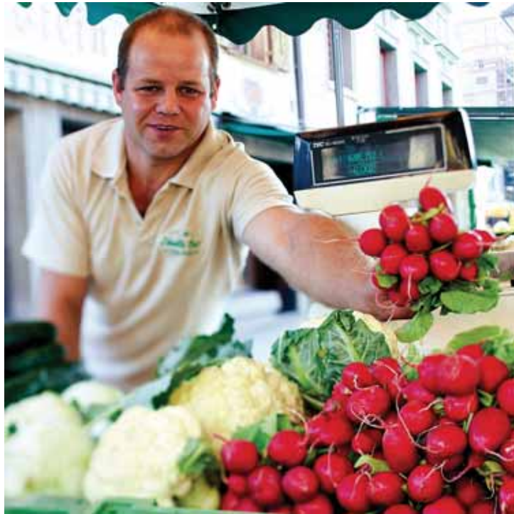
Bild 4: Direktvermarktern stehen alle Formen der Vermarktung offen.