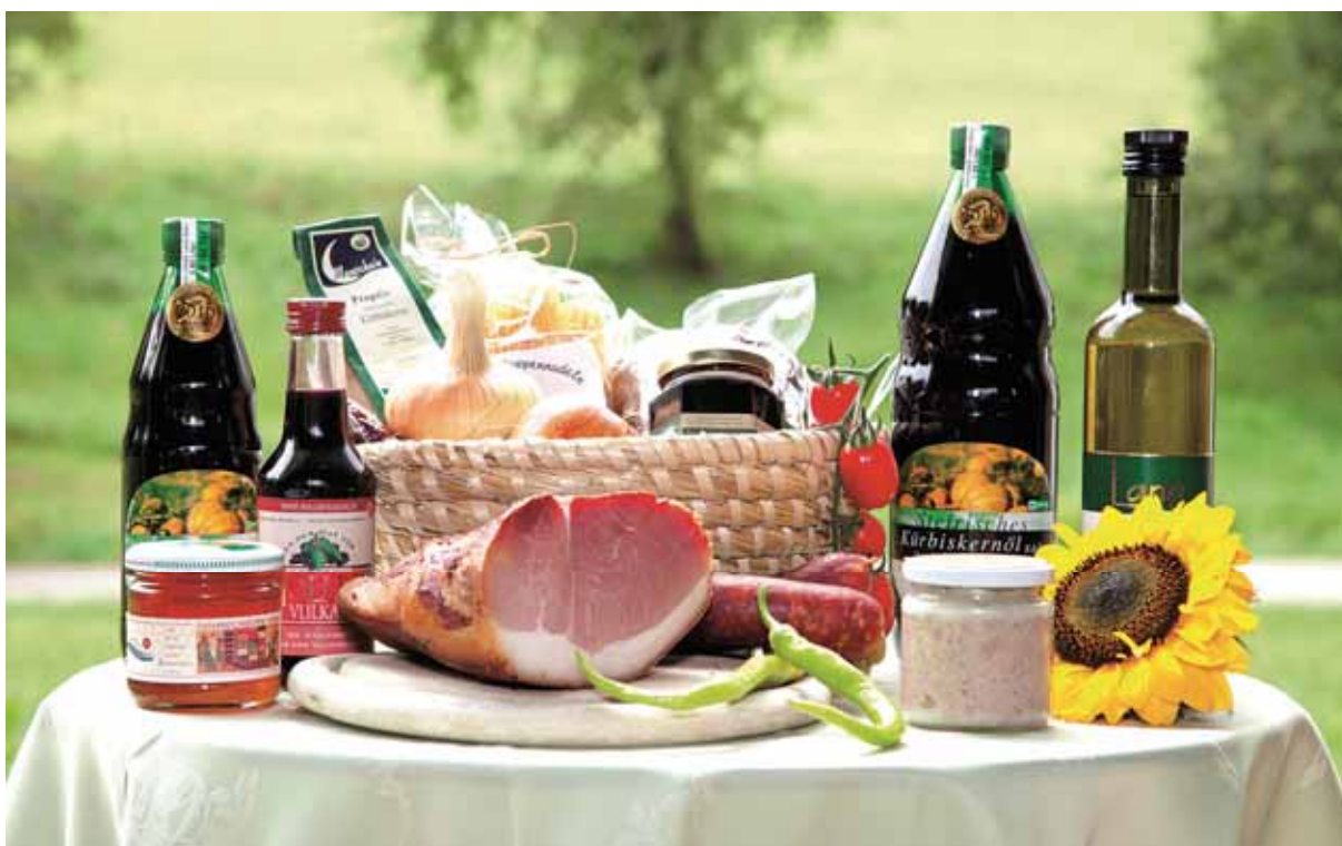
Bild 8: Einnahmen aus Be- und Verarbeitungserzeugnissen bis zu einer Höhe von € 33.000 zählen zu den Einkünften aus Land- und Forstwirtschaft

Gewinne aus der Direktvermarktung können steuerlich landwirtschaftlich oder gewerblich sein.