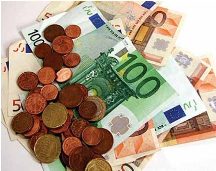
Bild 7: Die Begriffe Einnahmen, Einkünfte oder Einkommen haben unterschiedliche Bedeutung

Es gibt sieben verschiedene Einkunftsarten . Der Einkommensteuer wird das gesamte Einkommen zugrunde gelegt, das ein Steuerpflichtiger innerhalb eines Kalenderjahres aus den für ihn zutreffenden Einkunftsarten bezogen hat. Somit ist einkommensteuerlich keine Familienbesteuerung, sondern eine Individualbesteuerung vorgesehen. Übersteigt das Jahreseinkommen den Betrag von € 11.000, besteht idR die Pflicht zur Steuererklärung.