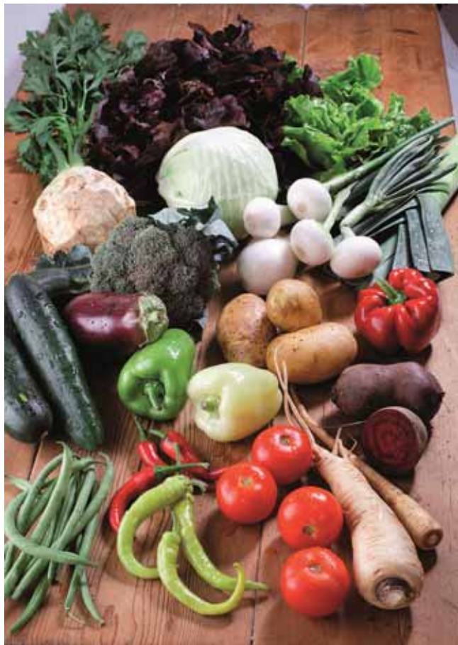
Bild 1: Die in der Urprodukteverordnung aufgelisteten Produkte werden nicht dem landwirtschaftlichen Nebengewerbe zugeordnet.

Die in der Urprodukteverordnung aufgelisteten Produkte dürfen Landwirte ohne Gewerbeberechtigung herstellen und sie werden nicht dem land- und forstwirtschaftlichen Nebengewerbe zugeordnet, selbst wenn für deren Herstellung Be- oder Verarbeitungsschritte notwendig sind. Die Unterscheidung zwischen Urprodukt und be- oder verarbeitetem Produkt ist insbesondere für das Steuer- und Sozialversicherungsrecht von Bedeutung.